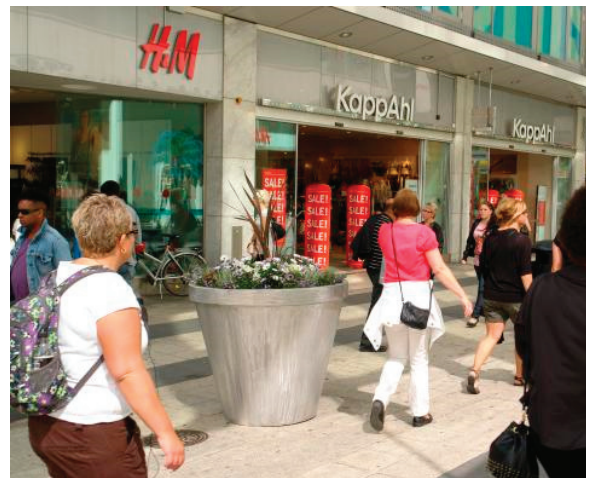
Folke Grande, 675 liter. Drottninggatan i Stockholm.

A för aluminium. S för svartmålad aluminium.