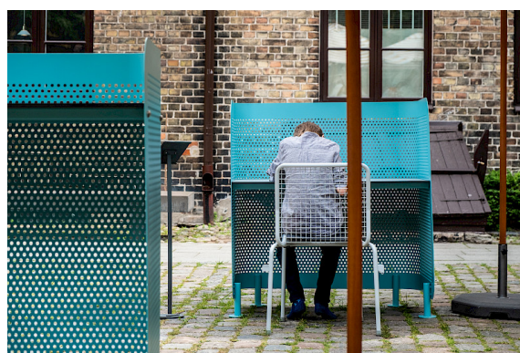
Work Desk under utställningen på Form/Design Center i Malmö.