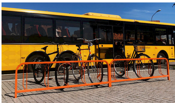
Ö03-13R special pulverlackerad