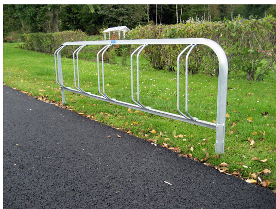
Ö03-13R, markfast cykelställ med rak inkörning