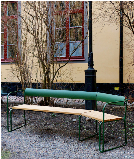
Sigill finns i en rak eller, som här, en vinklad version. Stativ pulverlackerat med ett finstruktur lack.