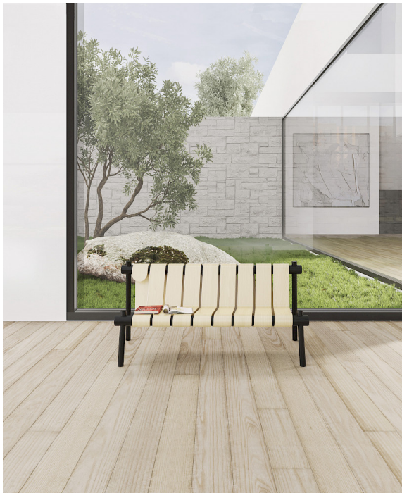
Bänken är formgiven enligt en metodik Marc Hoogendijk kallar teknomimetik, ett begrepp med inspiration från biomimetiken som efterliknar naturen. Teknomimetik imiterar i stället mänskliga tekniska konstruktioner.