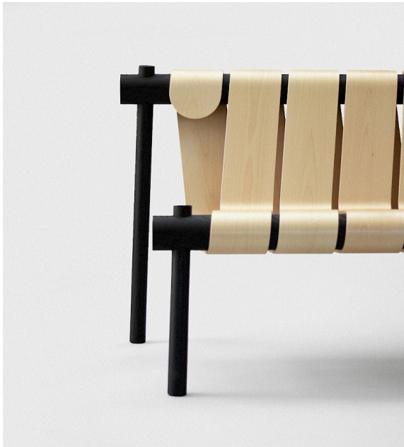
Vid första anblick ser ögat en profil av trä virad varv på varv runt en solid ram i ask, likt en serpentin.