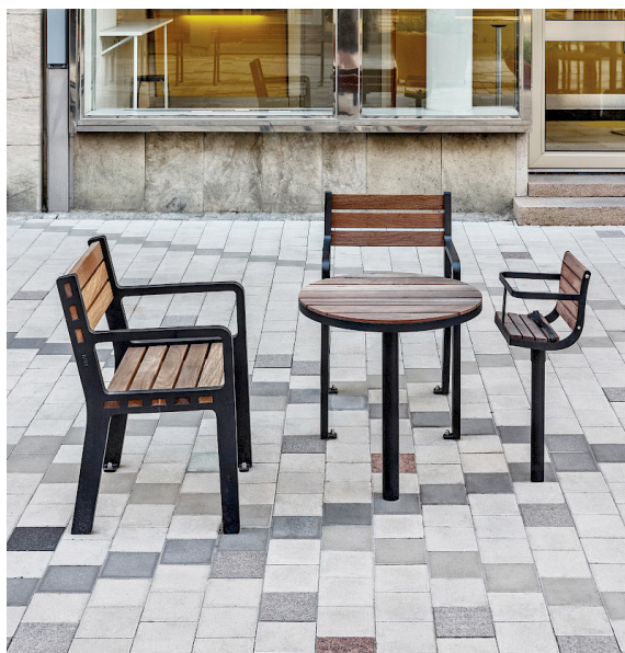
Parco bord och barnstol kombinerad med Frank fätsjö, formgiven av David Taylor, på Östra Drottninggatan i Gävle.