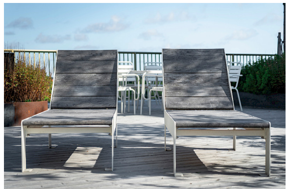
I Rosendal, Uppsala, fyller LowBed en av områdets takterrasser.