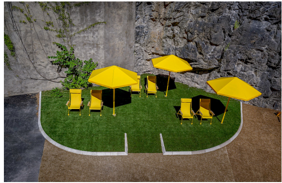
På Torsgatan i Stockholm syns de gula solstolarna Loj och Four Season väderskydd, båda formgivna av Thomas Bernstrand.