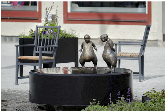
Inspirationen har hämtats från den klassiska trästolen som tillverkades i Leksand under tidigt 1800-tal. Bild: PE Teknik & Arkitektur