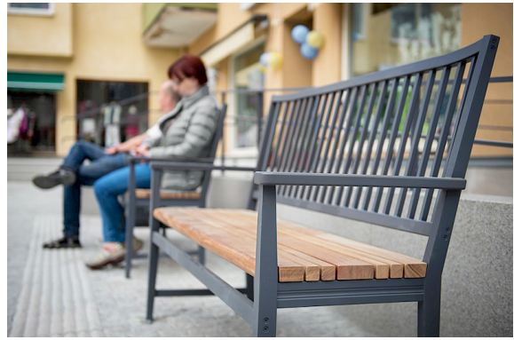
Bilder från Z-torget i Leksand kommun.