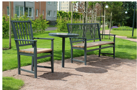
Leksand möbelgrupp i Åkerbyparken, Täby. Sitsar i obehandlad Cumaru är i stort sätt underhållsfria.