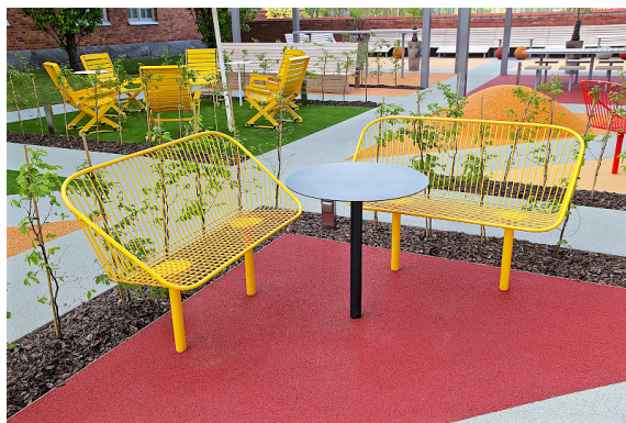
Från Castellums utomhuskontor WorkOut i Växjö.