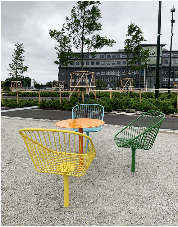
Otiba kulörer blandat i Västra Hamnen i Malmö.