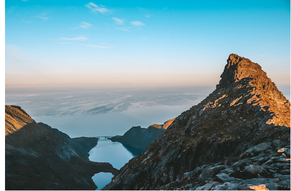
Kebne utegym är inspirerad av berget Kebnehaises bergstoppar och bidrar med det estetiska värdet av en skulptur i ett öppet landskap.