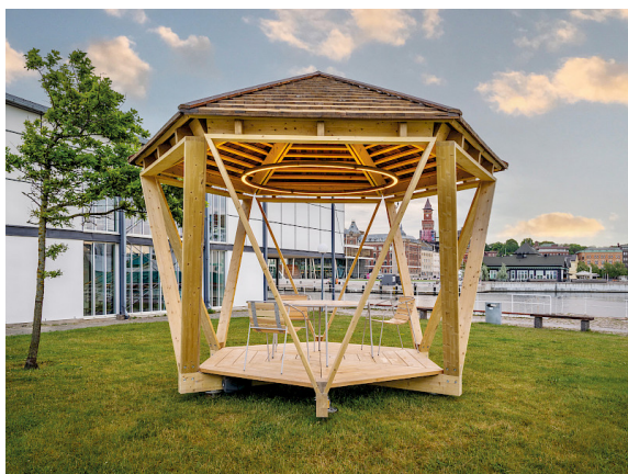
Hexagon under H22 City Expo i Helsingborg. Här med ljusarmatur formgiven av Marie-Louise Hellgren.