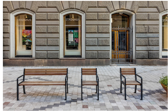
Frank fåtölj, formgiven av David Taylor, på Östra Drottninggatan i Gävle.