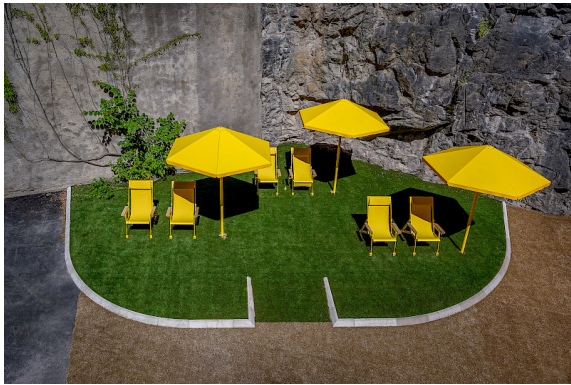
Även på Torsgatan i Stockholm syns de gula parasollerna.