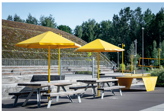
Väderskyddet Four Seasons av Thomas Bernstrand finns på flera ställen i Rosendals park i Uppsala och fungerar som en identitetsstark platsmarkör.