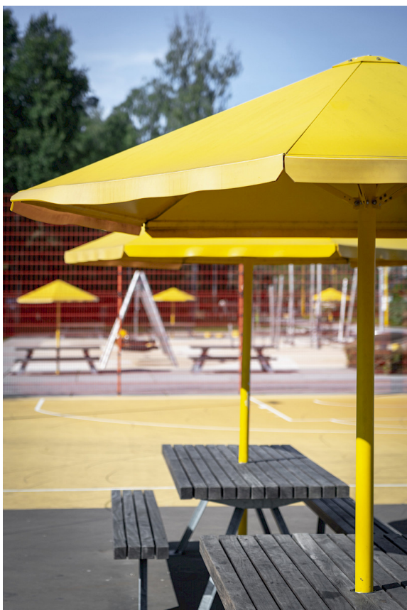
Four Seasons har i standardutförande en vinklad stolpe men går även att beställa med rak stolpe. Här i Rosendal, Uppsala.