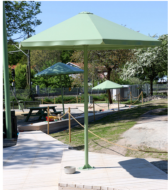
Bilden visar Four Seasons i RAL 6021. Väderskyddet går att få i ett flertal ytterligare RAL-färger. Startkostnad tillkommer.