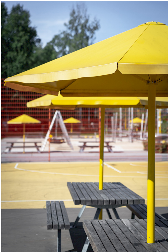
Four Seasons har i standardutförande en vinklad stolpe men går även att beställa med rak stolpe. Här i Rosendal, Uppsala.