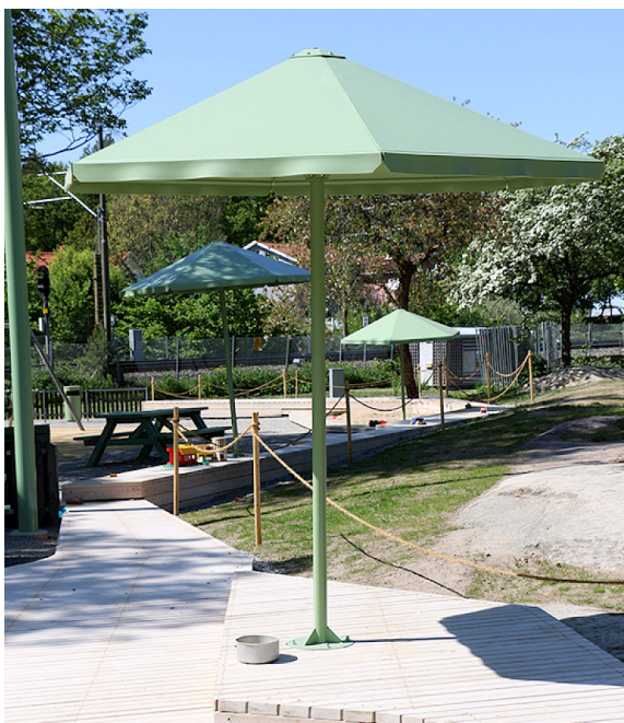
Väderskyddet går att få i ett flertal yttre RAL-färger. Startkostnad tillkommer.