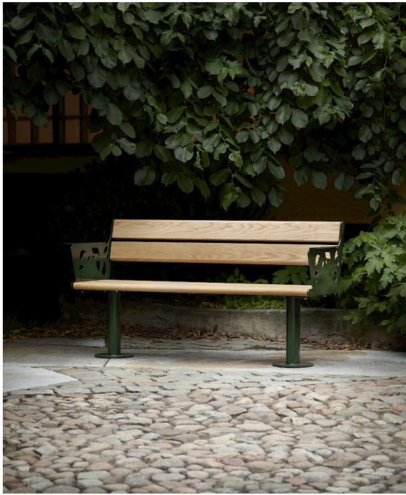
Genom att addera ett eget mönster till soffans sidostycken får man ett personligt uttryck och sin egen signatur på soffan.