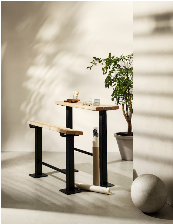
Tillsammans skapar Schoolyard bänk och bord en arbetsstation för utomhusklassrum.