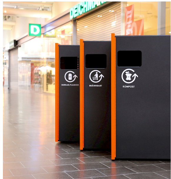
Bilden visar 3st Repeat i standardfärg. Kropp i Noir 2200 Sablé och sidostycke i orange RAL 2009. Obs! Dekaler för skräpsortering ingår ej.