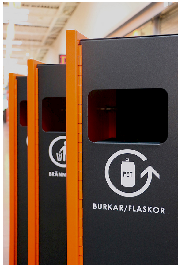
Bilden visar exempel på behållare.