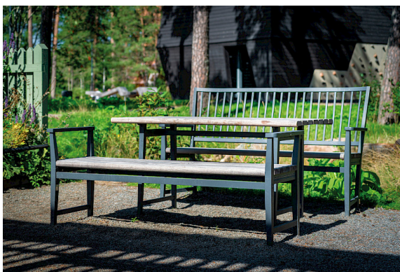
Leksand soffor, bord och bänk i Rosendals park, framtagen i samarbete med Temagruppen.