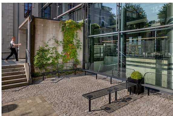
Korg möbelsystem utanför Chalmers i Göteborg. På bilden ses bänk med och utan rygg.