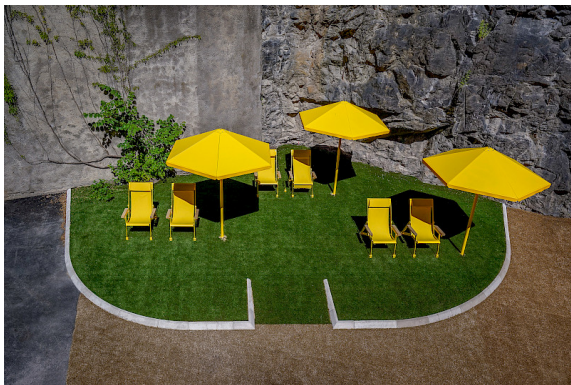
Även på Torsgatan i Stockholm syns de gula parasollerna.