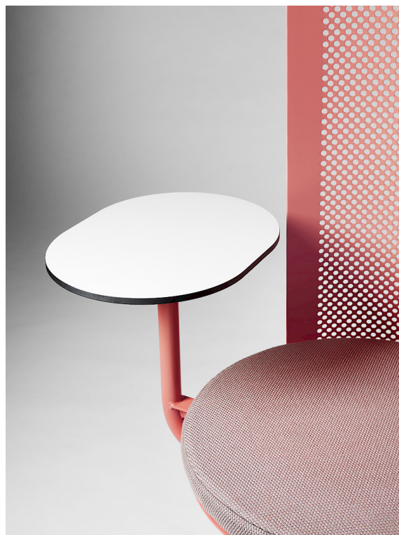
Die Tischoberfläche besteht aus hellgrauem Hochdrucklaminat mit schwarzem Kern.

Das Kissen ist mit 'Dry Foam' gefüllt und mit Stoff aus gefärbtem Acryl von Sunbrella bezogen. Das Kissen trocknet sofort und ist für den Außenbereich geeignet. Der Stoff ist außerdem UV-beständig und leicht sauber zu halten.