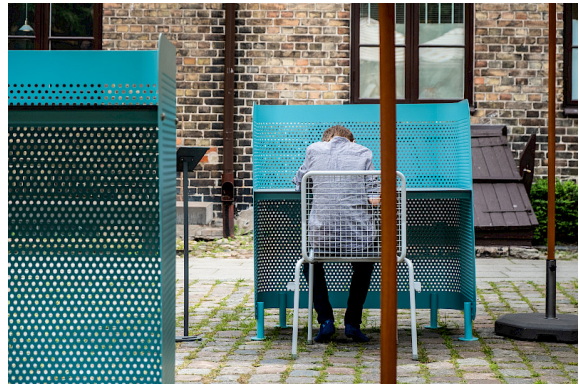
Schreibtisch während der Ausstellung im Form/Design Center in Malmö.