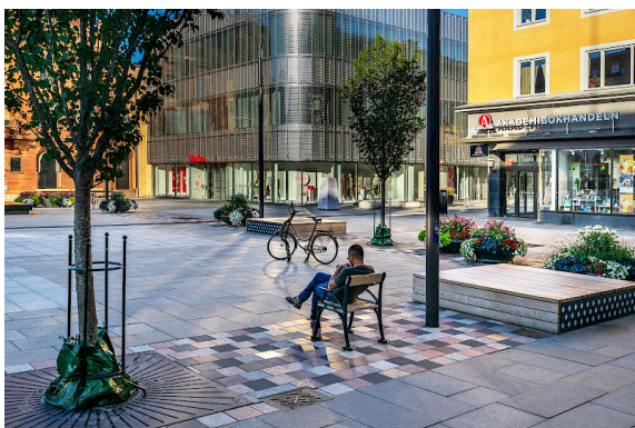
Tessin fätölj stora torget Uppsala