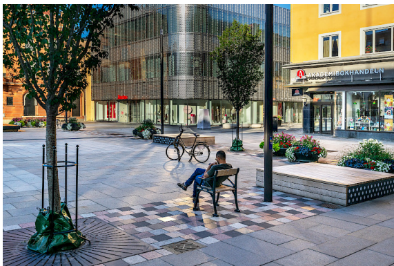
Tessin fätölj stora torget Uppsala