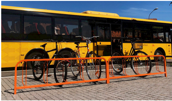
Ö03-13R special pulverlackerad