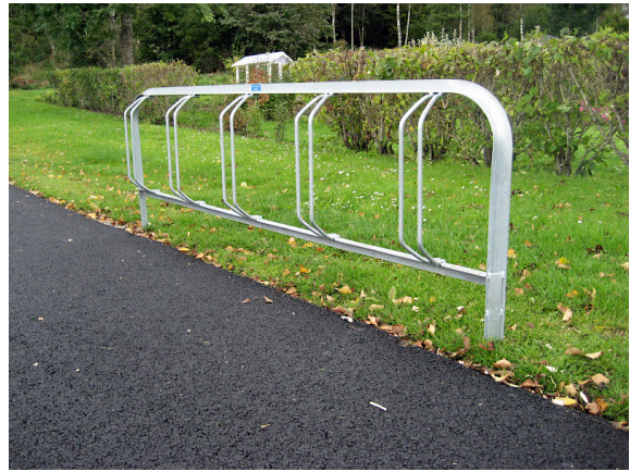
Ö03-13R, markfast cykelställ med rak inbörning