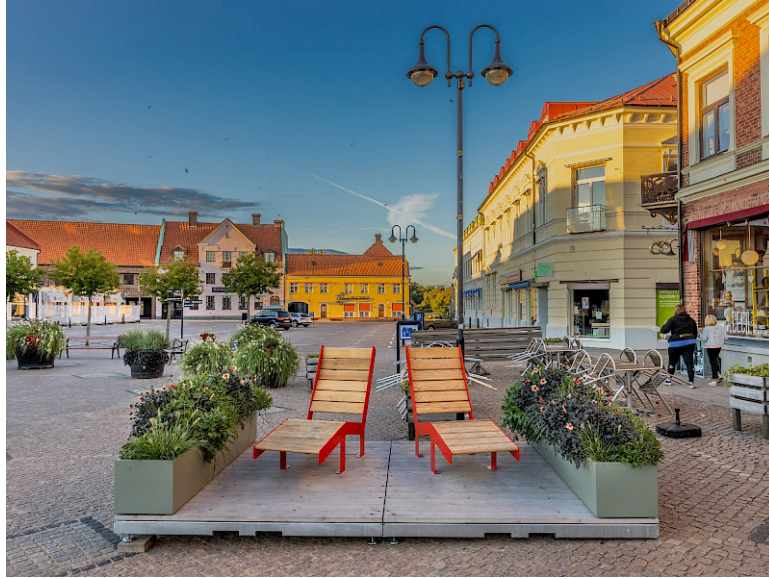
Parklet Planteringskärl Design Nola