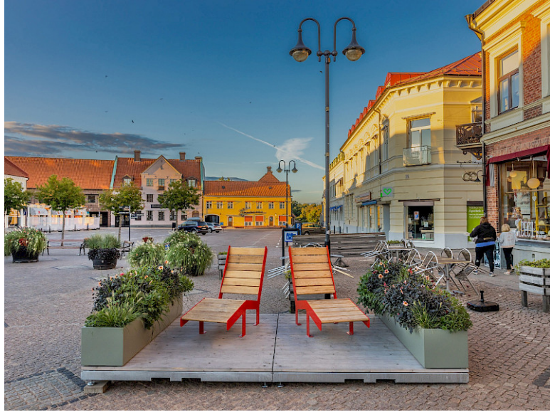
Parklet Planteringskärl Design Nola