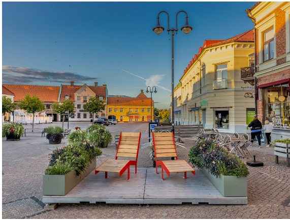
Module mit Pflanzgefäßen und dem Sonnenstuhl von Mats Aldén.