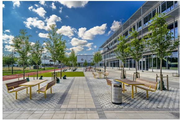
På Fomuddens skola i Tyresö kommun finns Parco parkbänk och bord i Jatoba med varierande kulörer på metalldelarna.