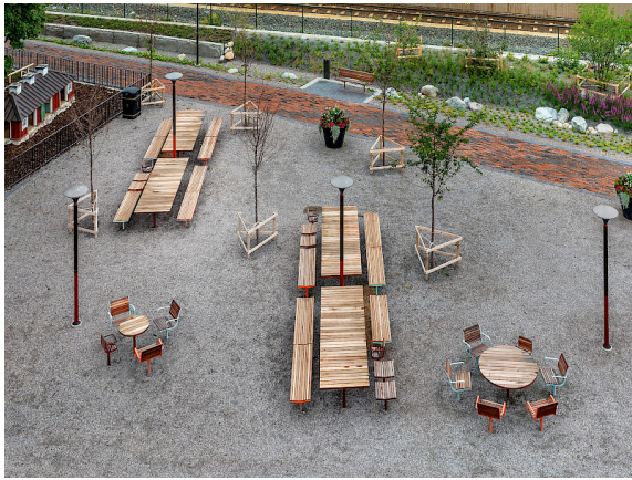
Parco in geölter Jatoba. Åbersberga Railway Park.