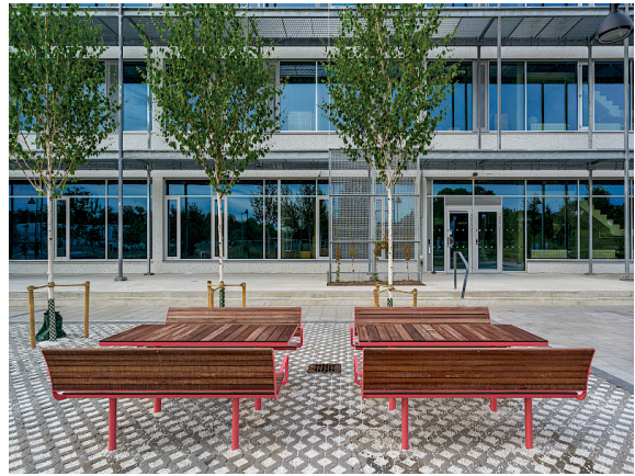
Parco-Sofa mit Armlehnen und rechteckigem Tisch, bodenmontierte Ständer. Holzart geölte Jatoba.