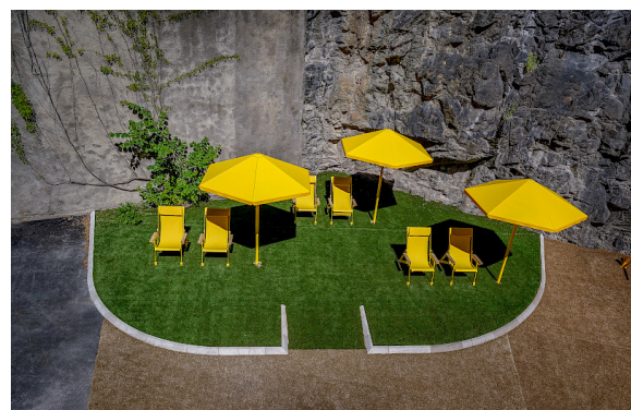
In der Torgatan in Stockholm sind die gelben Sonnentägen Loj und Four Season Wetterschutz zu sehen, die beide von Thomas Bernstrand entworfen wurden.