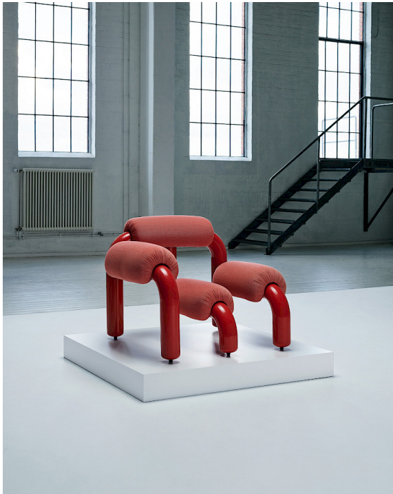
© Inter IKEA Systems B.V. 2020