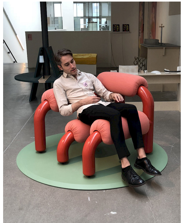
Konstfacks Abschlussausstellung 2018, Foto Martin Thübeck.