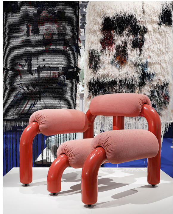
Ung Svensk Form 2019, ArkDes, Foto Jeanette Hagglund.