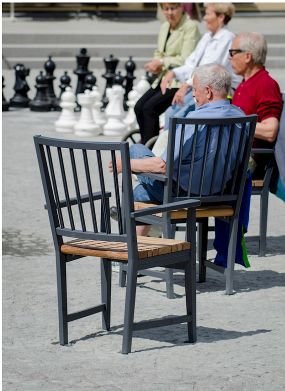
Mit einer etwas höheren Sitzhöhe (49 cm) ist der Stuhl barrierefrei. Die Armlehnen sind verlängert und gut zu greifen.