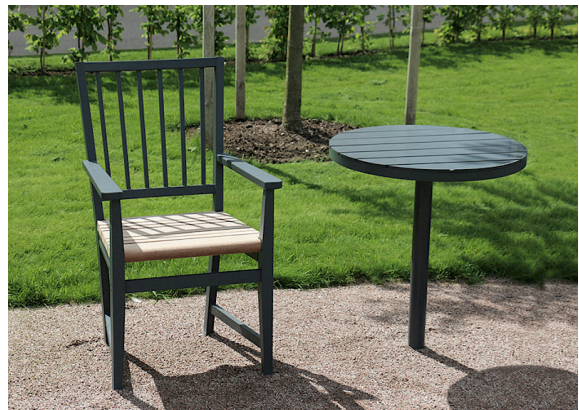
Leksand-Sessel neben einem runden Parco-Tisch.