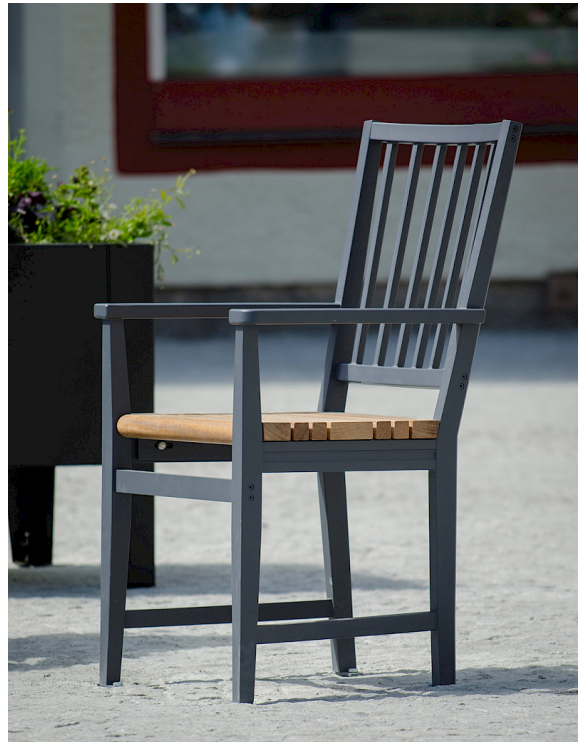
Leksand-Sessel, hergestellt in Zusammenarbeit mit Temagruppen. Fotos vom Z-torget in der Gemeinde Leksand.

Die Inspiration stammt vom klassischen Holzstuhl, der im frühen 19. Jahrhundert in Leksand hergestellt wurde.