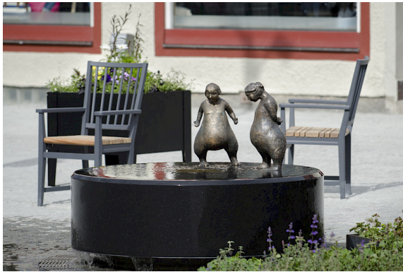
Die Inspiration stammt vom klassischen Holzstuhl, der im frühen 19. Jahrhundert in Leksand hergestellt wurde.