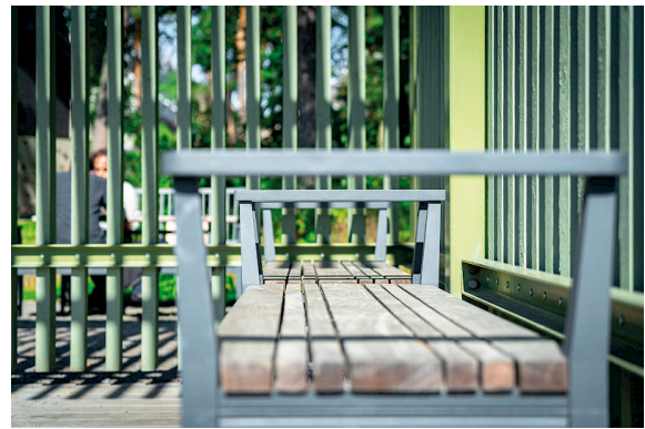
Leksand-Bank im Rosendalspark in Uppsala.