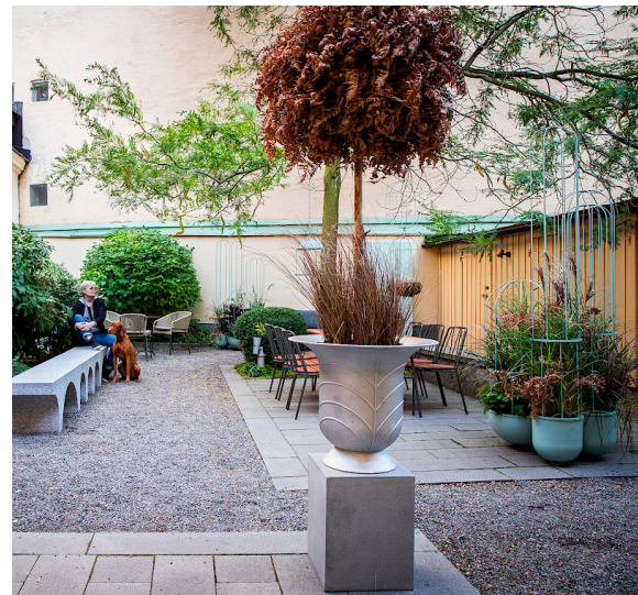
Klocka planteringsurna i återrunnen aluminium och stolen Rosseau med sits i FSC märkt mahogny.