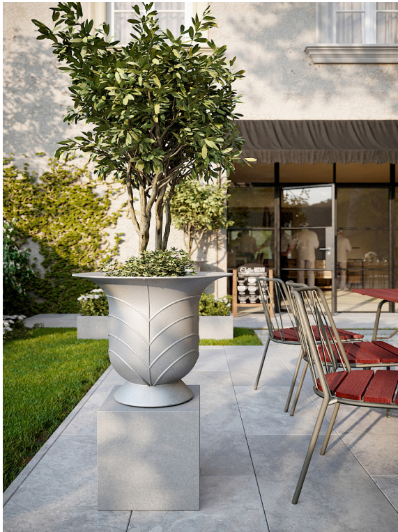
Klocka planteringsurna i återvunnen aluminium och stolar Rosseau med sits i FSC märkt mahogny.