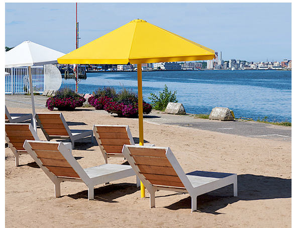
Vier-Jahreszeiten-Sonnenschirm, entworfen von Thomas Bernstrand, und Tiefbett am Playa Stenpiren in Göteborg.