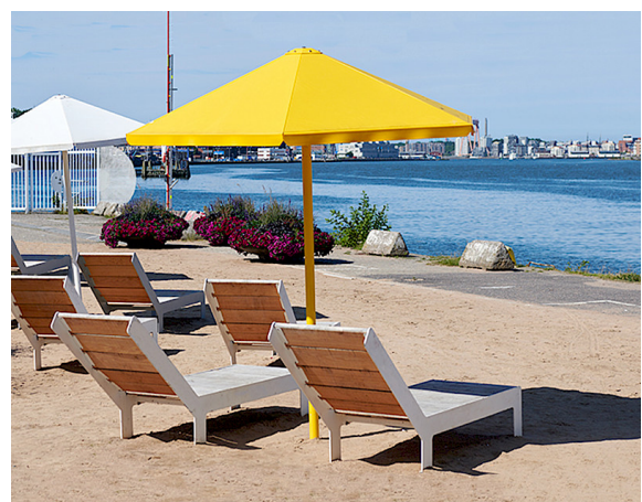
Vier-Jahreszeiten-Sonnenschirm, entworfen von Thomas Bernstrand, und Tiefbett am Playa Stenpiren in Göteborg.