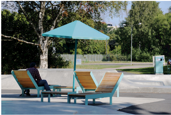
Das Low Bed erhellt den Tag für die Zuschauer im Skatepark Västerås.