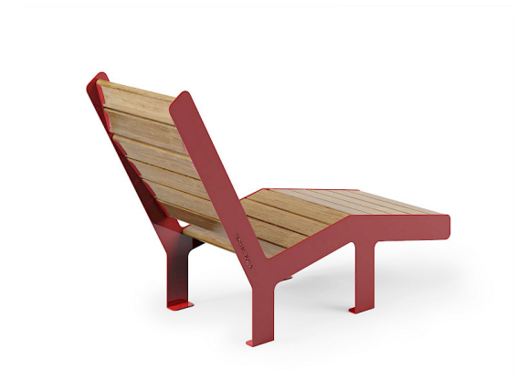
High Sunchair Neu 2022!