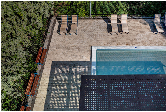
Die Produkte der Low/High-Gruppe sind die perfekte Wahl für Terrassen am Pool, in maritimen Bereichen, in Parks am Wasser und auf Terrassen am Strand.