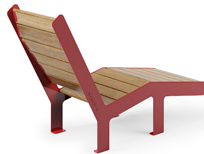
High Sunchair Neu 2022!