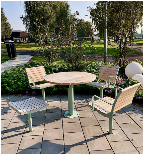
High Table zusammen mit Sesseln und Hockern aus unserer Parco-Möbelserie.