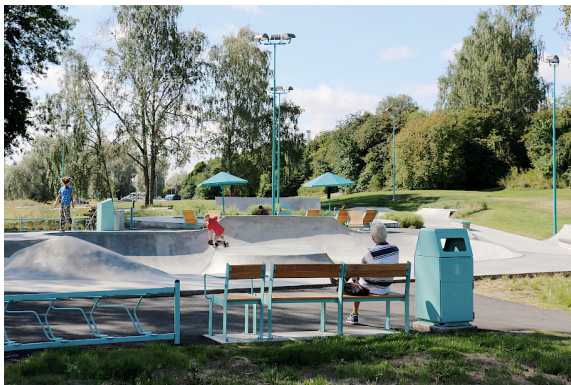
Im Skatepark von Västerås können Sie bequem als Zuschauer im Hochstuhl und im Hochsofa sitzen.