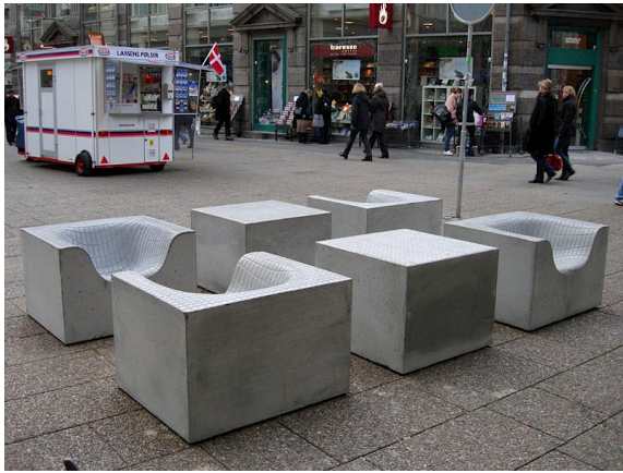
Concrete Things Fåtölj och Bord i betong.