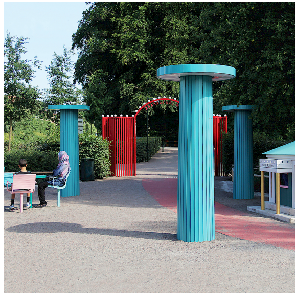
Teaterlekplatsen in Malmö